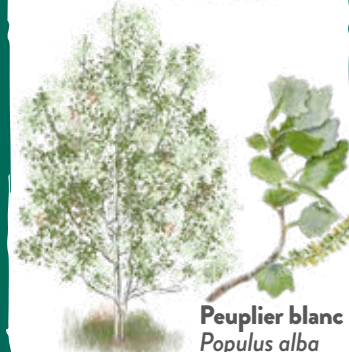
Peuplier blanc Populus alba