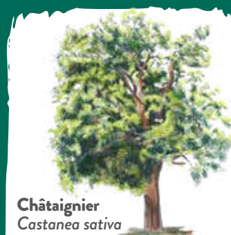
Châtaignier Castanea sativa

La richesse floristique est aussi illustrée par la présence d'une espèce peu commune : le Jonc de Desfontaines ( Juncus fontanesii ).