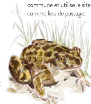
Le Pélobate cultripède affectionne les mares temporaires de la commune et utilise le site comme lieu de passage.

Des actions comme la conservation de vieux arbres ou la création de noues (fossés) permettent d'améliorer les habitats propices à certaines espèces, favorisant ainsi la biodiversité.