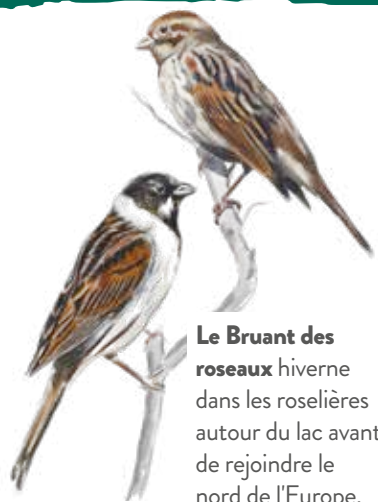
Le Bruant des roseaux hiverne dans les roselières autour du lac avant de rejoindre le nord de l'Europe.

S'y retrouvent de nombreuses espèces d'oiseaux, de libellules ou d'amphibiens. Des espèces classées "en danger d'extinction" (EN) sur les listes rouges régionales de l'UICN* ont été répertoriées en octobre 2022.